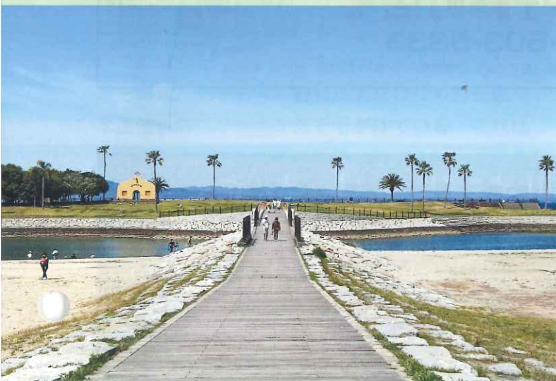
田ノ浦ビーチ (大分市)