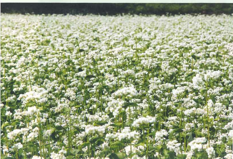
そばの花 (豊後高田市)